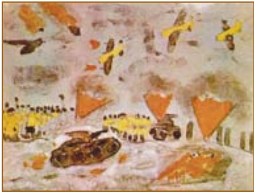
Валя Яковлев, 7 лет 5 месяцев. "Сейчас наши бойцы прогонят немцев, и мы прорвём блокаду. И война кончится".