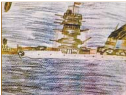
Юра Павлов, 6 лет. "Когда я вырасту, буду капитаном. Я буду ехать по морю, вражеские корабли топить, а когда вернусь из плавания, подвезу к вашему дому и привезу вам батоны, и шоколаду, и круглые булочки".