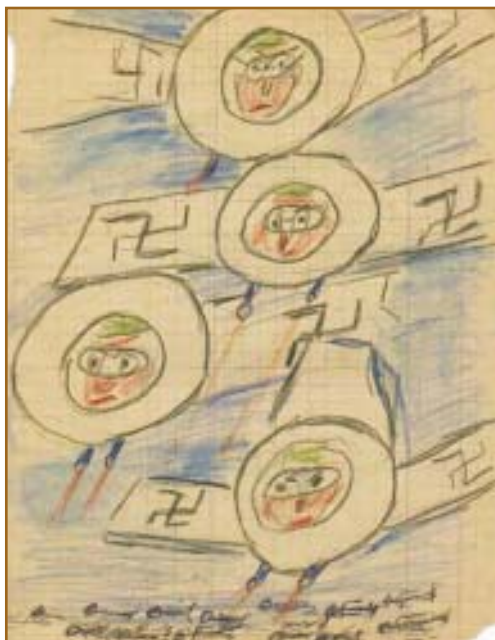
Лева Ч., 7 лет. 23.06.41. "Налет "мессеров" на нашу границу".